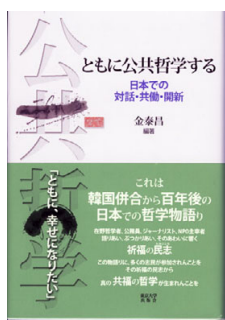
『ともに公共哲学する』 東京大学出版会