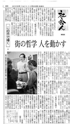
2009年11月22日(日) 日経新聞 「街の哲学 人を動かす」

わたしの33年間の教育と哲学の実践を紹介する記事でしたが、その最後の部分に、参議院での講義についても触れています。