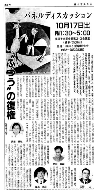
緑と市民自治6号 (92年10月10日発行)

わたしが我孫子市民会館で主催した「ふつうの復権」と題するパネルディスカッションは、現状変革の政治・社会運動が依拠していたマルクス主義の発想を、哲学次元から変えるための企画でした。当時は、市民運動も旧左翼的な思想に依拠していて、巨大理論に頼る悪弊から抜け出せずにいました。自由対話による等身大の思想の構築、民主的倫理に基づく生き方、生活世界からの哲学の立ち上げとは異なり、特定のイデオロギーや戦略的思考が横行し、「民主主義」とは、真剣に追求すべき価値、深化・拡大すべき課題ではなく、一応の価値に過ぎないという風でした。