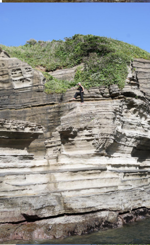
砂岩と泥岩の地層。崖（がけ）が続く。