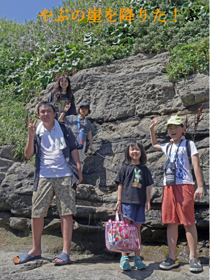
やぶの崖を降りた！