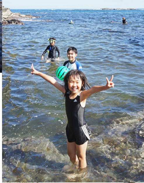
つゆは海水おそば(笑)