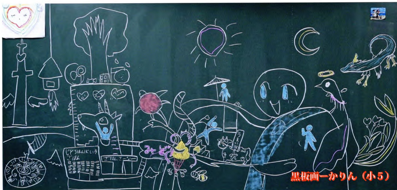
黑板画ーかりん (小5)